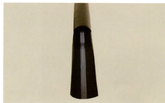
写真① 注:写真は見えやすくするために上部を切り取っております。

シルバードリップを用意し、その内側にドリップラインがある事を確認します。(写真①参照)